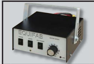
Contrôleur de vitesse d'habitacle Incab variable speed control