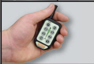
Contrôleur à 5 vitesses sans fil Wireless 5 speed control